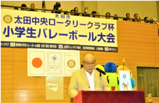
清水聖義 太田市長