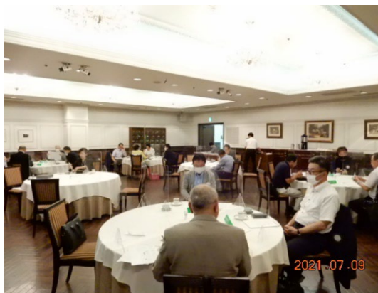
小坂橋エレクト 榮井副会長 家泉副幹事