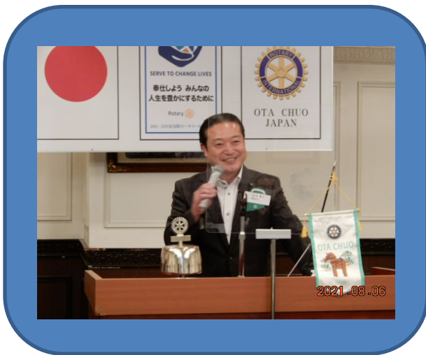
松本ガバナー補佐